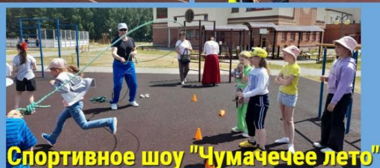
Спортивное шоу "Чумачеее лето"