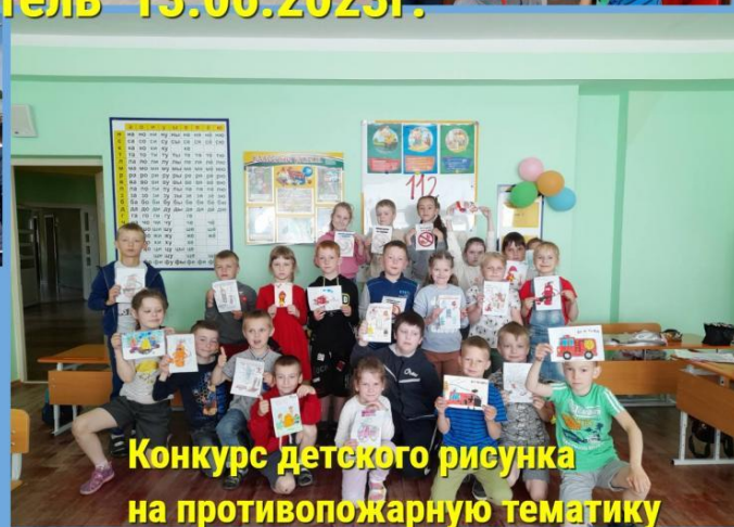
Конкурс детского рисунка на противопожарную тематику