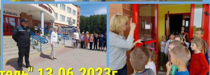
Станция "Юный спасатель" 13.06.2023г.