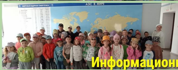
Информационный центр "Белорусская АЭС"