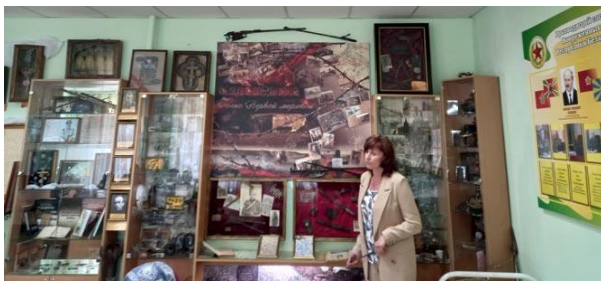
Посещение Мядельской центральной библиотеки