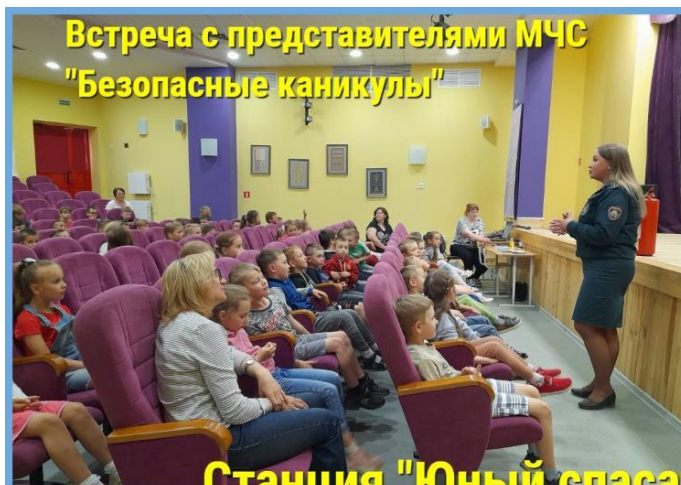
Встреча с представителями МЧС "Безопасные каникулы"