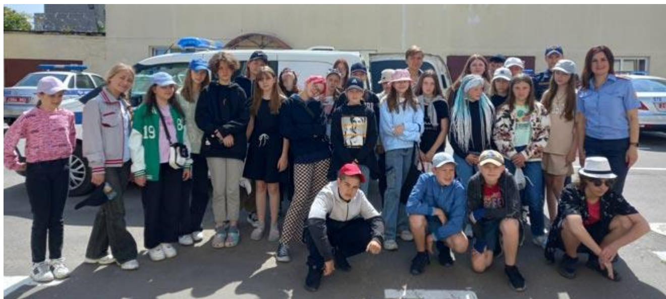
Посещение музейной экспозиции в райвоенкомате