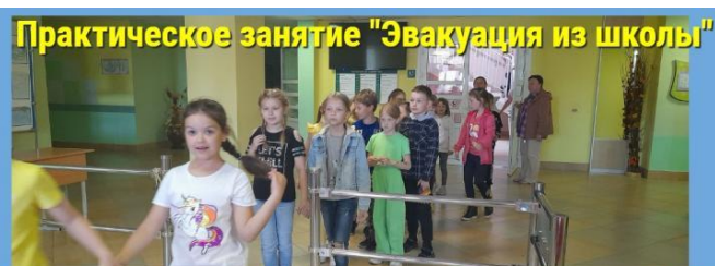
Практическое занятие "Эвакуация из школы"