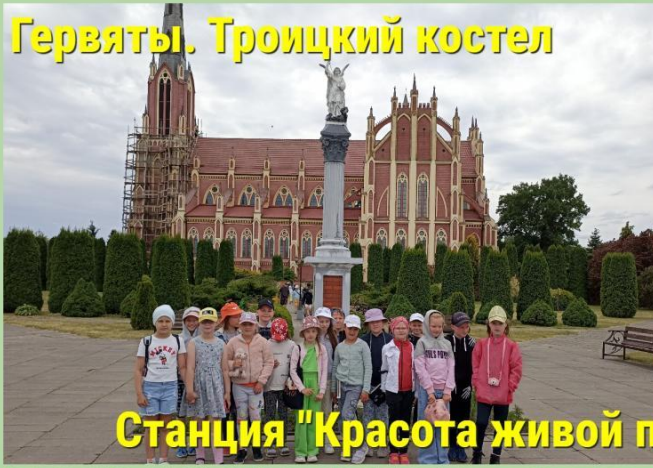
Станция "Красота живой природы" 12.06.2023